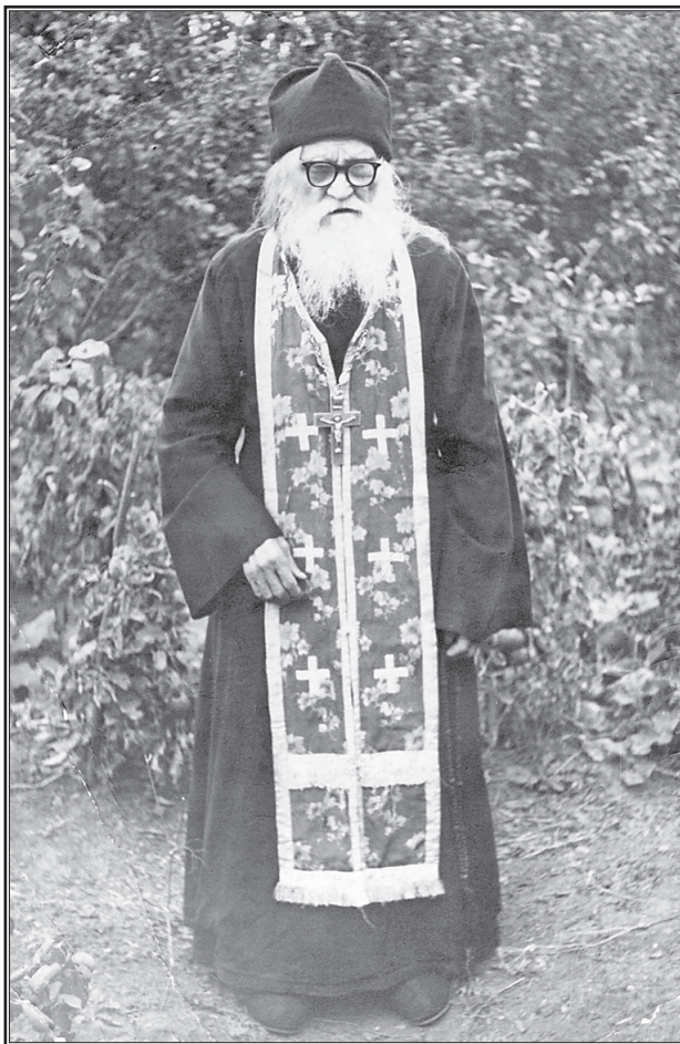
Схиигумен Павел (Драчев)