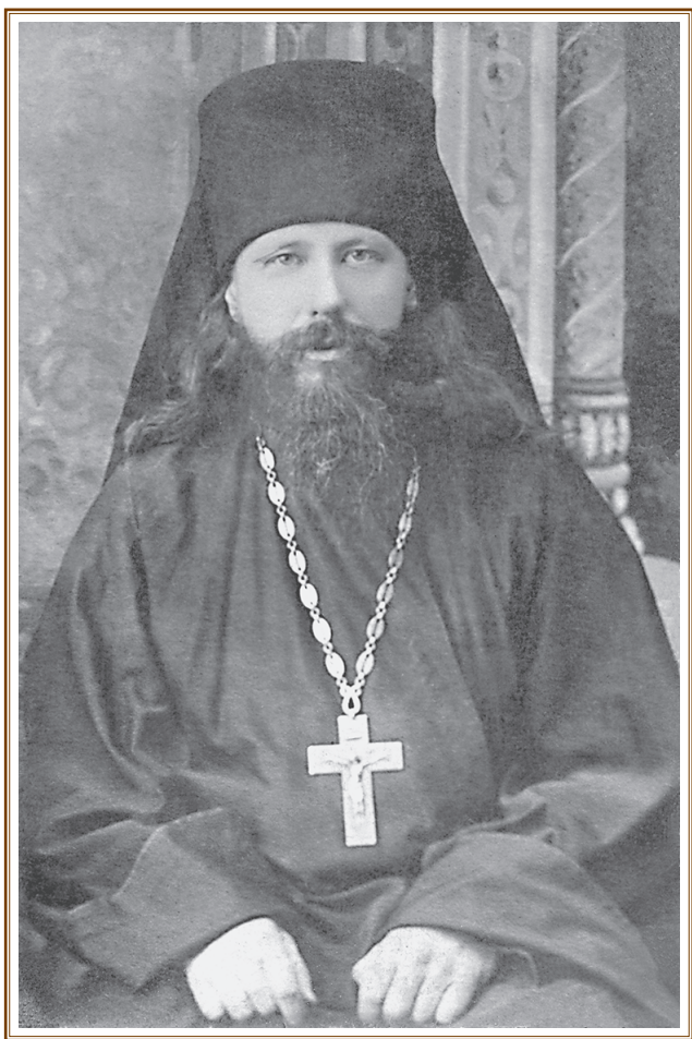
Преподобный Никон исповедник