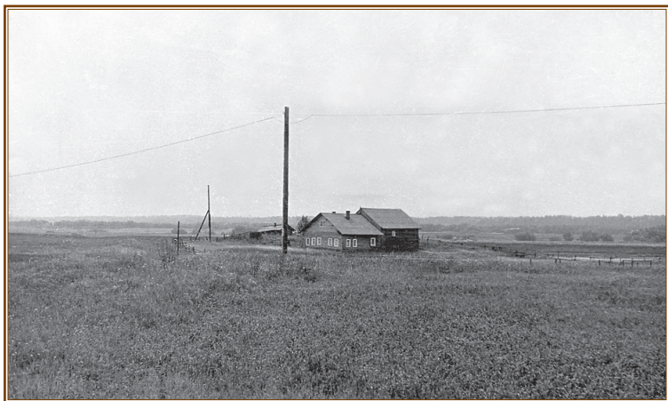
Деревня Козлово, место ссылки. Дом, где скончался иеромонах Никон