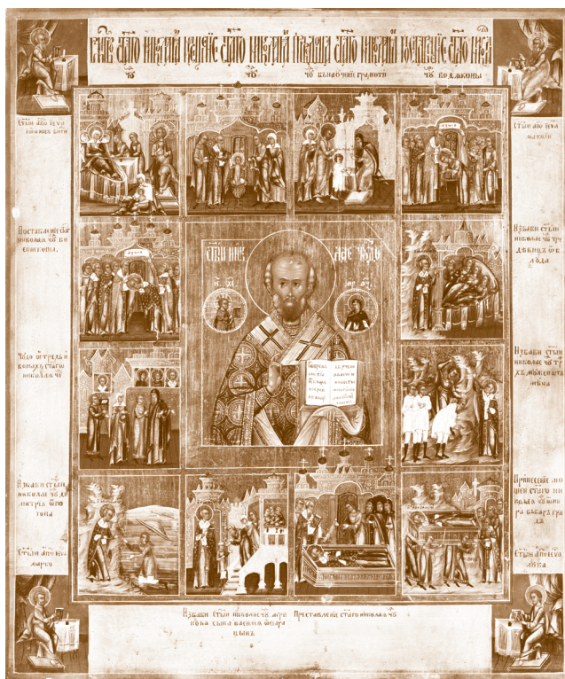
Святитель Николай Чудотворец, с 12 клеймами и евангелистами на полях. Середина XIX века. Палех. Эта икона была с будущим исповедником в ссылке