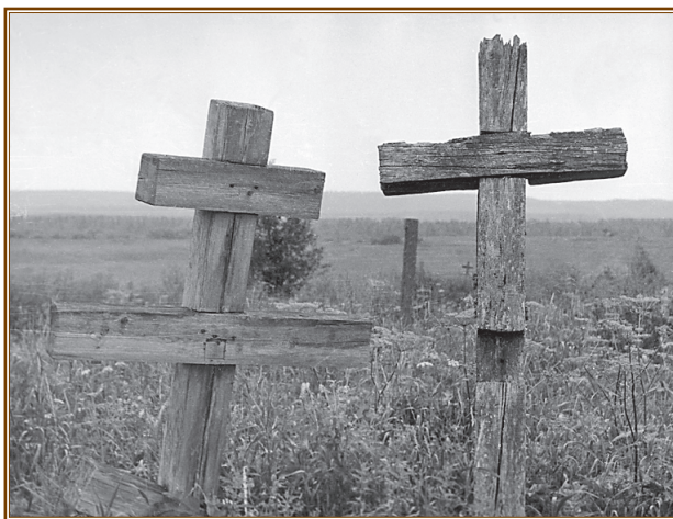
Старое сельское кладбище, где под спудом находятся мощи исповедника

1931 года и был погребен на деревенском кладбище в безвестной ныне могиле.