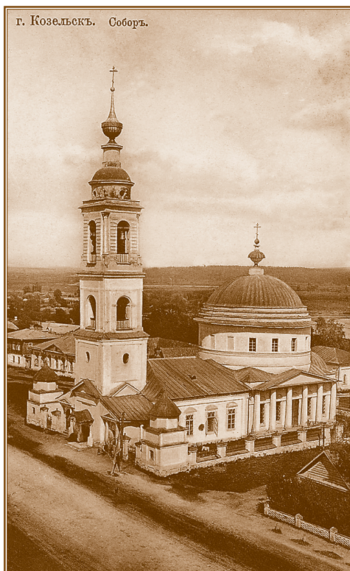
Козельск. Собор в честь Успения Божией Матери. Открытка начала XX века