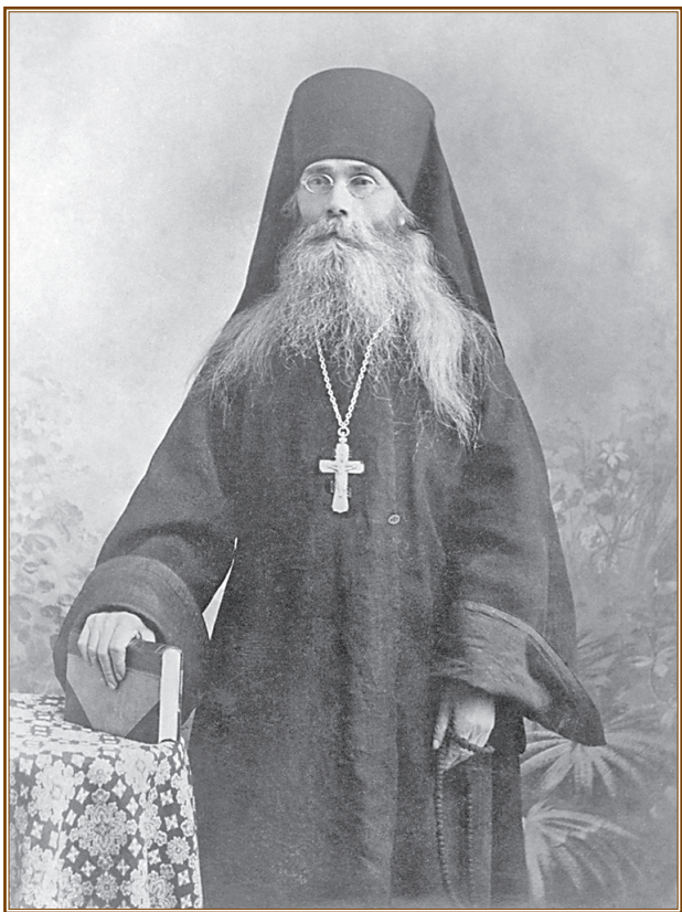
Преподобный Варсонофий, старец Оптинский