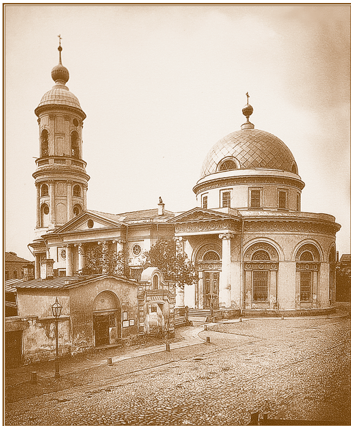
Церковь в честь иконы Божией Матери «Всех скорбящих Радость» на Большой Ордынке в Москве. Фотография. 1882 год