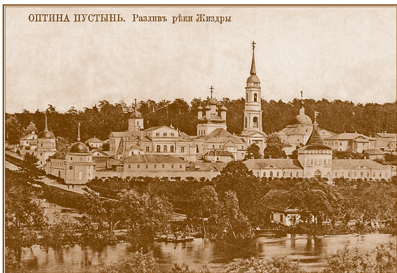
Введенская Оптиная пустынь. Вид с северо-западной стороны. Открытка начала XX века