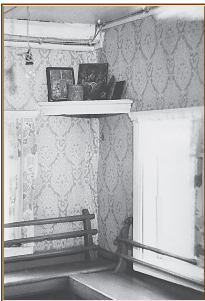
В этой комнате под иконами почил преподобный Никон исповедник